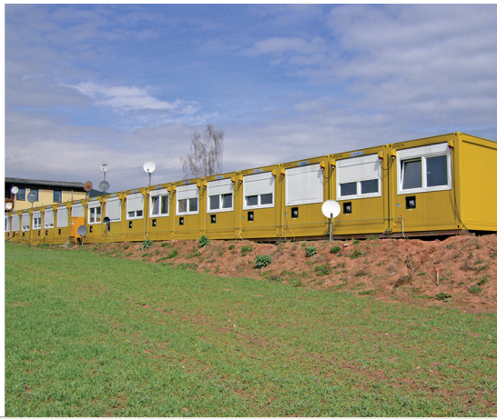
▲ Versorgung einer Containeranlage mit 36 Wohn- und Sanitärcontainern