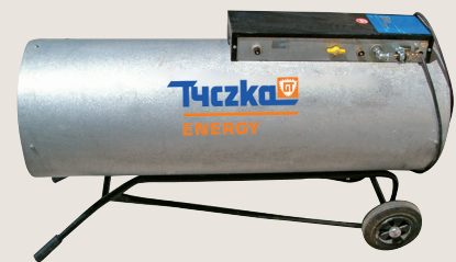
▲ Mobiler, direkt befeuerter Gasluftheritzer