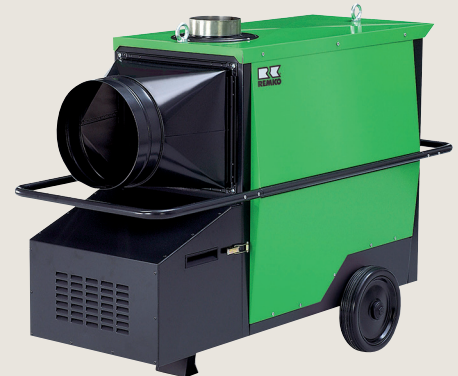
▲ Stationärer, indirekt befeuerter Gasluftheritzer