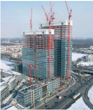
▲ Winterbaubeheizung von zwei Hochhäusern, einem Büro- und einem Hotelkomplex