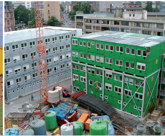
▲ Versorgung einer Containeranlage mit 144 Büro- und Tagesunterkuntscontainern